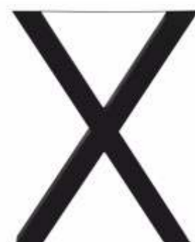
X Statafel | 3150 H 105 B 80 Profiel: 100 x 100 mm.