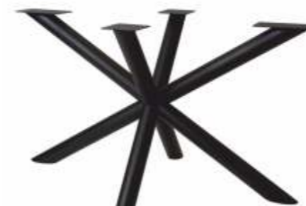
Spin 130 Pipe | 3191 H 72 B 73 L 130 Profiel: Rond 80 mm.