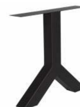
Model Y | 3154 H 71 B 80 Profiel: 100 x 100 mm.