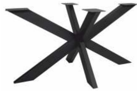
Spin 140 | 3176 H 71 B 140 L 80 Profiel: 50 x 100 mm.