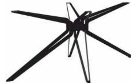
Dining Drone Slim | 3193 H 72 B 130 L 61,5