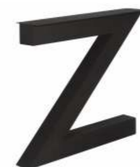
Model Z | 3149 H 71 B 80 Profiel: 100 x 100 mm.