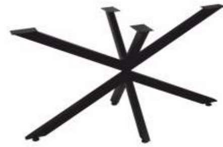
Spin 142 | 3161 H 71 B 142 L 70 Profiel: 40 x 60 mm.