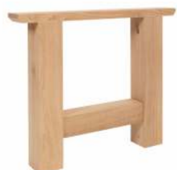
Model H | Eiken H 72 B 90 Profiel: 120 x 120 mm.