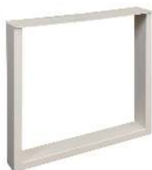
U Elegant | 3151 H 71 B 80 Profiel: 40 x 100 mm.