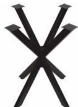
Lexileg Diamond | 3158 H 71 B 61 L 61 Profiel: 50 x 30 mm.