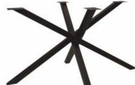
Spider 2 | 3169 H 71 B 120 L 72 Profiel: 50 x 50 mm.