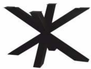
Spin 120 | 3155 H 71 B 120 L 80 Profiel: 100 x 100 mm.