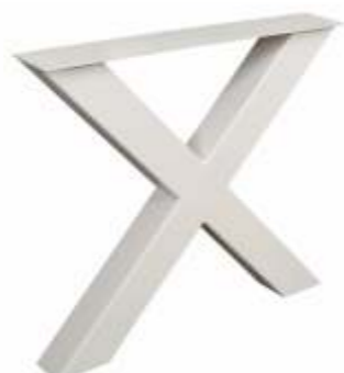
Model X | 3150 H 71 B 80 Profiel: 100 x 100 mm.