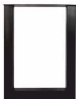
U Statafel | 3152 H 105 B 80 Profiel: 100 x 100 mm.