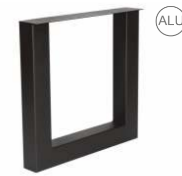
Model U | 3152 H 71 B 80 (90) Profiel: 100 x 100 mm.