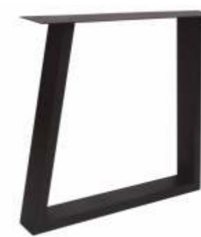
U Trapezium Elegant | 3164 H 72 B 80 Profiel: 40 x 100 mm.