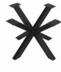
Spin Salon 80 | 3172 H 35 B 50 L 48 Profiel: 40 x 40 mm.