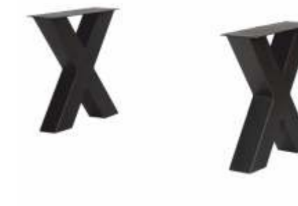
X Bankje | 3151-A H 42 B 38 Profiel: 80 x 80 mm.