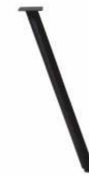
Model Basic 1a | 3184A H 71 Profiel: Rond 50 mm.