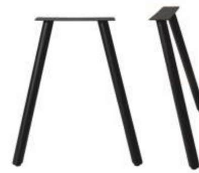
Model Basic 1 | 3184 H 71 B 24/65 Profiel: Rond 50 mm.