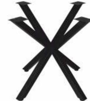
Spin 85 | 3177 H 71 B 85 L 85 Profiel: 50 x 50 mm.