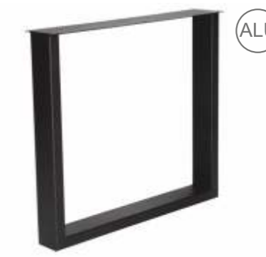
U Elegant | 3151 H 71 B 80 Profiel: 40 x 100 mm.