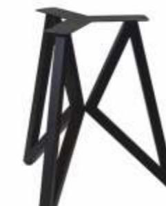
Butterfly | 3187 H 72 B 62 L 72 Profiel: 42 x 42 mm.