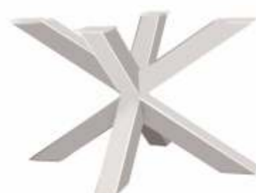
Spin 120 | 3155 H 71 B 120 L 80 Profiel: 100 x 100 mm.