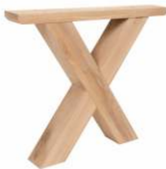
Model X | Eiken H 72 B 90 Profiel: 120 x 120 mm.