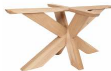
Model Spin 6 | Eiken H 72 B 96 L 162 Profiel: 140 x 80 mm.