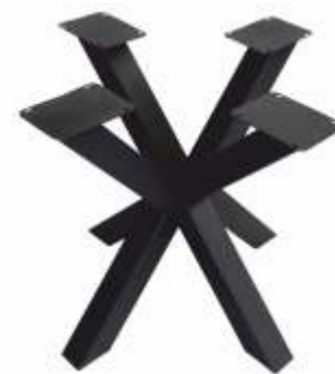
Spin 80 | 3174 H 71 B 80 L 80 Profiel: 80 x 80 mm.