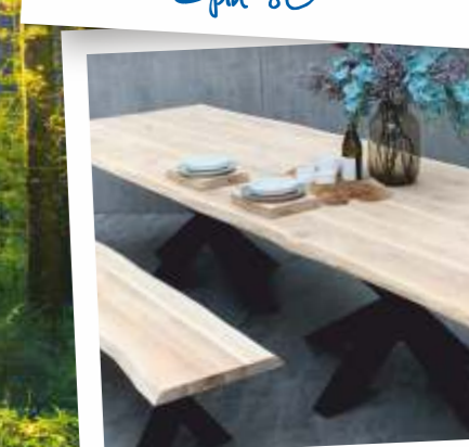
Spin 120 + Kleine X