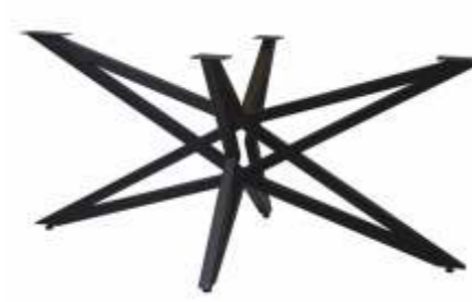
Shooting star 160 | 3192 H 71 B 160 L 80 Profiel: 40 x 40 mm.