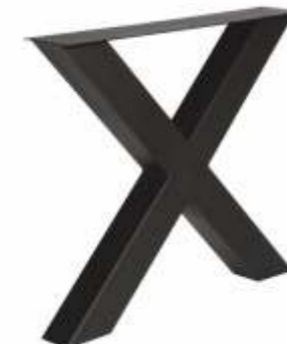
Model X | 3150 H 71 B 80 Profiel: 100 x 100 mm.