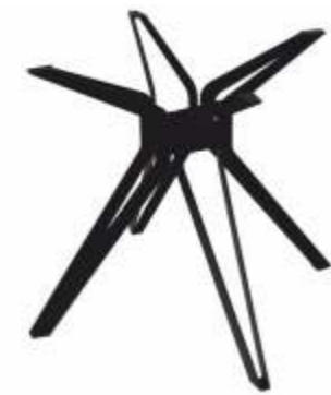
Dining Drone 4 | 3194 H 72 B 78 L 78