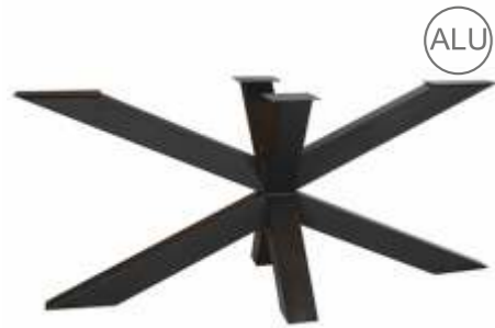
Spin 160 | 3171 H 71 B 160 L 80 Profiel: 100 x 100 mm.