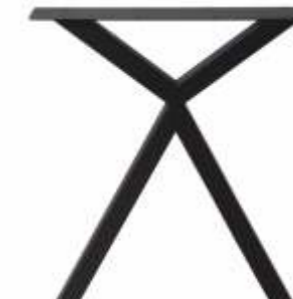
Basic 2 | 3185 H 71 B 60 Profiel: 40 x 40 mm.