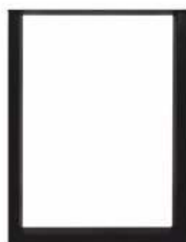
U Statafel | 3151 H 105 B 80 Profiel: 50 x 100 mm.