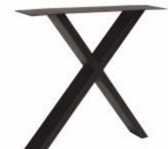
X Elegant | 3163 H 72 B 80 Profiel: 40 x 100 mm.