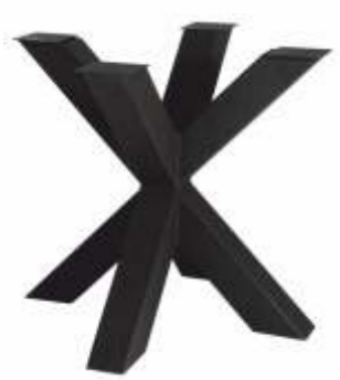
Spin 80 | 3156 H 71 B 80 L 80 Profiel: 100 x 100 mm.