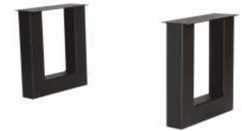
U Bankje | 3152 H 42 B 38 Profiel: 80 x 80 mm.