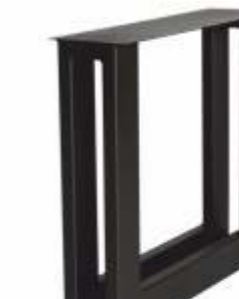
Dubbele U | 3153 H 71 B 80 Profiel: 40 x 100 mm.