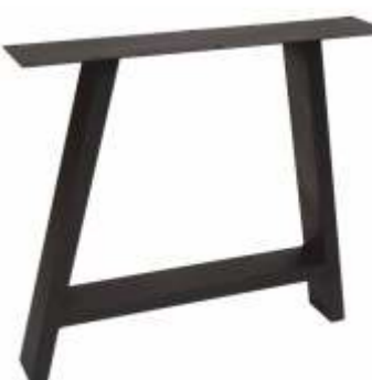
A Elegant | 3167 H 72 B 80 Profiel: 40 x 60 mm.