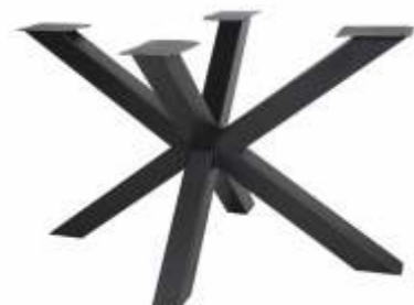
Spin 120 | 3175 H 71 B 120 L 80 Profiel: 80 x 80 mm.