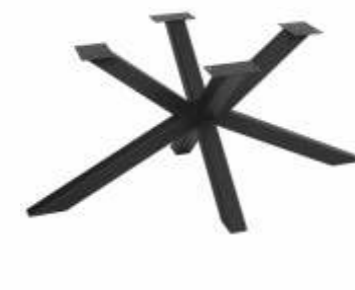
Spin Salon 120 | 3173 H 35 B 120 L 80 Profiel: 40 x 40 mm.