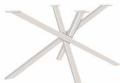
Spider 2 | 3169 H 71 B 120 L 72 Profiel: 50 x 50 mm.