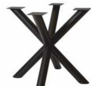
Spin 80 Pipe | 3190 H 72 B 80 L 80 Profiel: Rond 80 mm.