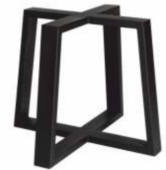
Trapezium Mixer | 3157 H 71 B 74 L 74 (90) Profiel: 40 x 100 mm.