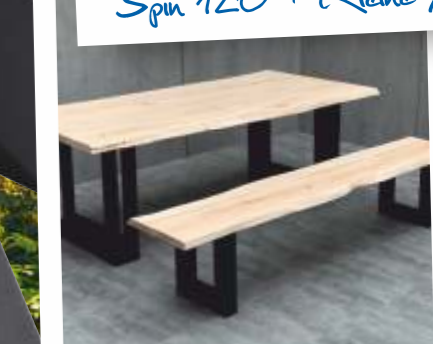
Dubbele U + Kleine U