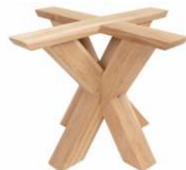
Model Spin 4 | Eiken H 72 B 96 L 96 Profiel: 120 x 120 mm.