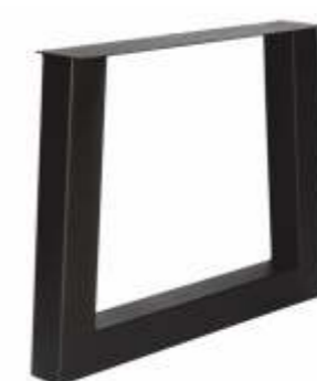
U Trapezium | 3148 H 71 B 80 (90) Profiel: 100 x 100 mm.